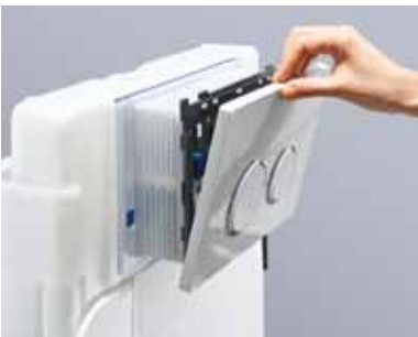
Schließen: Einfach Betätigungsplatte wieder zuklappen und Frische bei jeder Spülung genießen.

Ein neuer Einwurfschacht für Reinigungswürfel macht es jetzt auch im Unterputz-Spülkasten kinderleicht, die Toilette immer mit hygienisch frischem Wasser zu spülen: Klappe auf, Reinigungswürfel rein, hygienische Frische für Wochen sichern.