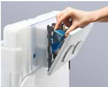
Einwerfen: Jetzt kommt der Reinigungswürfel in den Einwurfschacht.