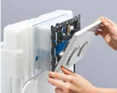
Öffnen: Mit einer Hand lässt sich die Geberit Sigma10/20/50 Betätigungsplatte aufklappen.